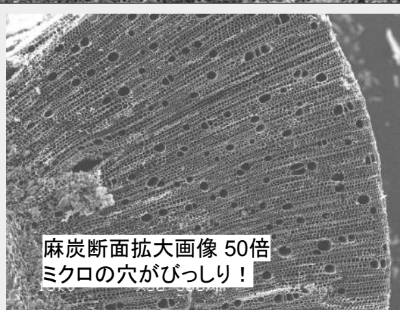
麻炭断面拡大画像 50倍 ミクロの穴がびっしり！