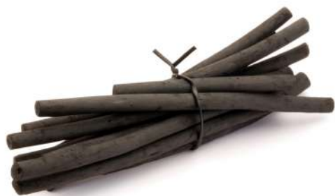
麻の茎の部分が麻炭になります。

麻炭の多孔質性は備長炭の4倍、竹炭の1.6倍と言われ、吸着に優れた素材です。 多孔質生はデトックス&クレンジング効果を生む活性炭特有の構造です。