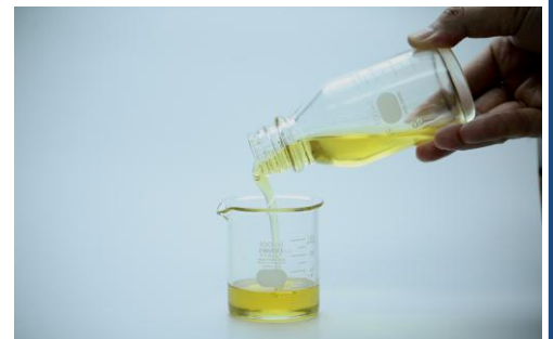
常温で流動性のよい液体です