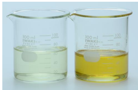
10%液(写真左)との比較(右は60%液)