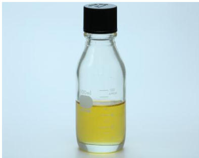
製品写真(サンプル瓶)